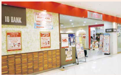
ホリデーじゅうろく正木（正木支店 マーサ21 1階）

全店のお客さまに気軽にご来店いただける新しいサービスとして、平成28年10月に『ホリデーじゅうろく名古屋駅前』（名古屋駅前支店）、平成28年11月には『ホリデーじゅうろく正木』（正木支店）で休日営業をスタートしました。平成29年10月には『ホリデーじゅうろく岐南』（岐南支店）が新店舗移転と同時にスタートする予定であり、さらなるお客さまの利便性向上に努めていきます。