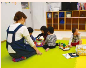
実現した16項目の提言の1つである企業内保育施設「じゅうろくスマイルルーム」