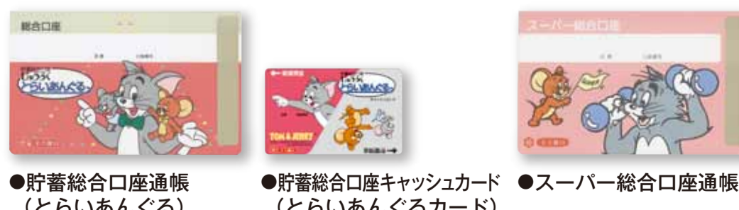
●貯蓄総合口座通帳(とらいあんぐる) ●貯蓄総合口座キャッシュカード(とらいあんぐるカード) ●スーパー総合口座通帳

右記デザインの通帳&カードは、平成25年2月15日(金)をもって新規受付を終了させていただきます。