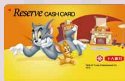
貯蓄預金キャッシュカード