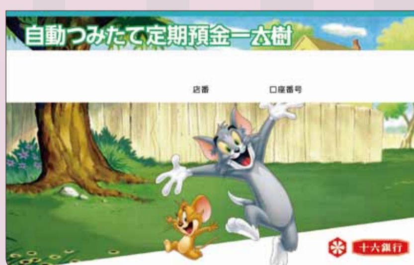
自動つみたて定期預金(大樹)