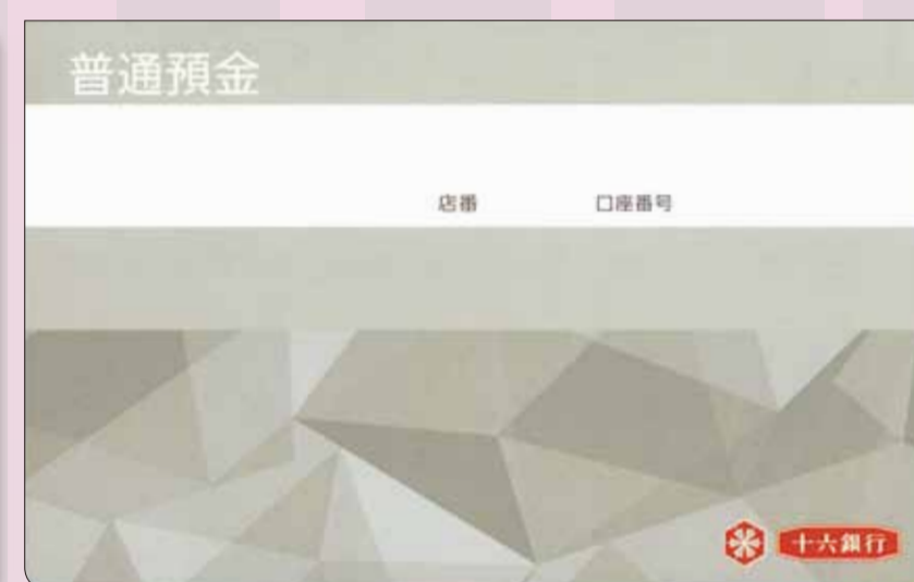
普通預金通帳(一般)