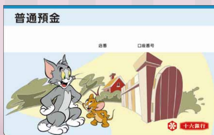
普通預金通帳(トムとジェリー)