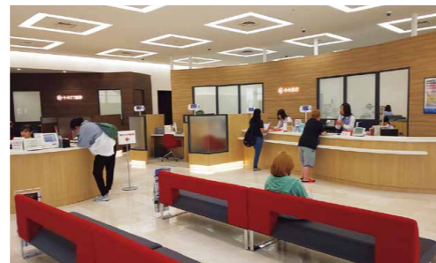
当行初の銀証共同店舗となる大垣支店