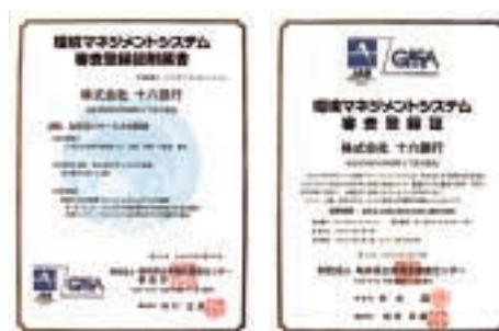
環境マネジメントシステム審査登録証

本店ビルおよび事務センターにおいてISO14001の認証を取得し、省資源・省エネルギー活動などの環境負荷低減活動に加え、環境対応型金融商品の取扱いなど、間接的な環境保全活動にも積極的に取り組んでいます。平成19年3月には、外部審査機関によるISO更新審査をクリアし、引き続き、地域金融機関として、環境に配慮した企業活動に努めてまいります。