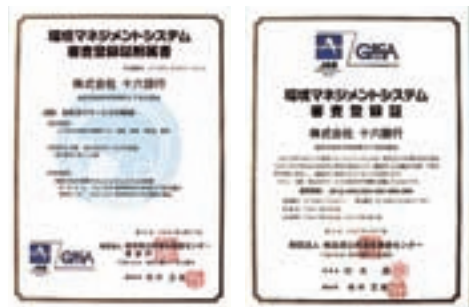
環境マネジメントシステム審査登録証

本店ビルおよび事務センターにおいてISO14001の認証を取得し、省資源・省エネルギー活動などの環境負荷低減活動に加え、環境対応型金融商品の取り扱いなど、間接的な環境保全活動にも積極的に取り組んでいます。平成20年3月には、外部審査機関によるISO定期審査をクリアし、引き続き、地域金融機関として環境に配慮した企業活動に努めてまいります。