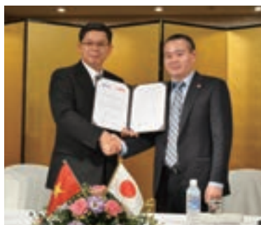
ベトナム投資開発銀行への研修生派遣に関する合意書調印式の様子(平成26年8月)

お取引先企業の海外進出支援業務に精通した人材の育成を図るとともに、海外拠点や海外提携金融機関のネットワーク拡充を進め、お取引先企業の海外進出支援を一層強化していきます。