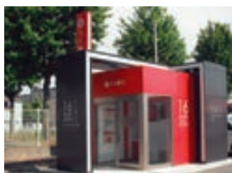
DCMカーマ21熱田店 ATMコーナー