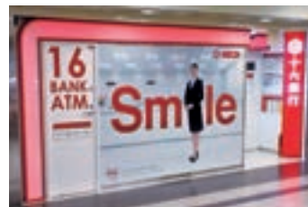
栄森の地下街ATMコーナー

市営地下鉄栄駅は、地下鉄名古屋駅に次いで利用の多い駅であり、毎日多くのお客さまにご利用いただいています。