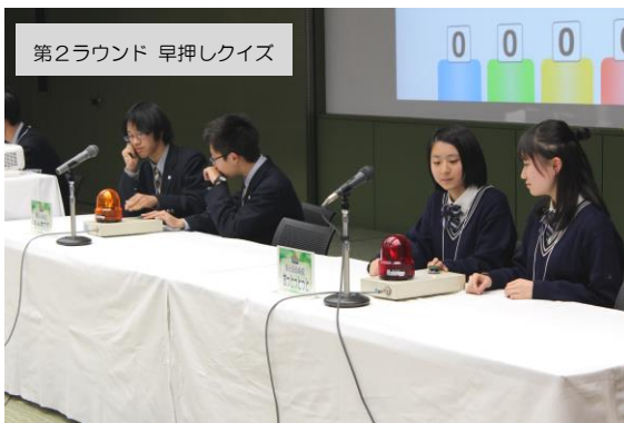
第2ラウンド 早押しクイズ