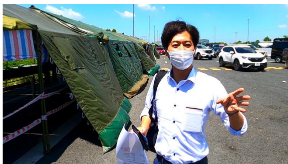
ハノイ駐在員事務所