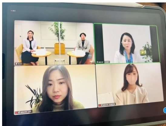
第2部座談会の様子