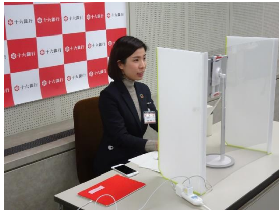
十六銀行 Jewelia 事務局 後藤