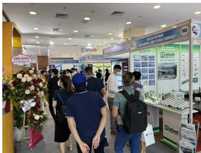
「ベトナム会場の様子」