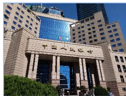
【写真1】中国人民銀行 (中国の中央銀行)

デジタル人民元は、DCEP (Digital Currency Electronic Payment) と呼ばれ、中国人民銀行【写真1】が発行を目指しているデジタル通貨です。中国人民銀行は2014年からデジタル人民元の開発に着手しており、一部地域での限定的な試験を経て2020年10月には広東省深圳市で5万人規模、12月には江蘇省蘇州市で10万人規模の実証実験を実施しました。また、2021年2月の春節には四川省成都市でデジタル人民元の「紅包(お年玉)」総額4000万元(約6億4000万円)が20万人に配布されるなど、着々と実証実験が進んでいます。深圳市での実証実験では、抽選で選ばれた市民が、デジタル人民元を入金する専用アプリをスマートフォンにダウンロードし、200元(約3,400円)のデジタル人民元を無償で受け取り、商店やレストランなどで支払いに利用しました。また、年配者などスマートフォンを所持していない層や、その操作に不慣れな層にまで幅広い普及を図るべく、「カード型」のハードウォレットもテスト使用されました。このカード型ハードウォレットの右上部には小さな画面があり、支払額や残額、オフライン使用可能回数が表示される仕組みになっており、誰でも簡単に使用できるよう配慮されていました。