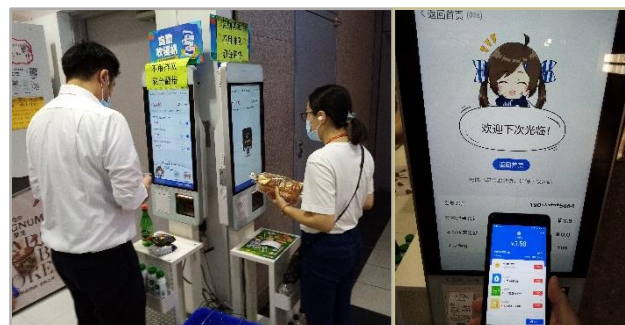
【写真2】 キャッシュレスの浸透によりコンビニでもスマホ決済のセルフレジが増えている

中国では既に Alipay (支付宝) や WeChat Pay (微信支付) といった民間のスマホ決済がかなり普及しており、消費者の決済手段のデジタル化が著しく進展しています【写真2】。デジタル人民元とこれら民間のスマホ決済との決定的な違いは、デジタル人民元が法定通貨であるということであり、それが両者の信用リスクの差につながります。ただし、中国のスマホ決済企業は、利用者から預かった前払い金の100%に相当する額を中国人民銀行に預けることが義務付けられているため、それがしっかり遵守されている限り、その金銭的価値が中央銀行により実質的に保証される形となっています。つまり、デジタル人民元とスマホ決済は、信用リスクの面ではほとんど変わらないといえます。また、実際の利用方法という点では、デジタル人民元と民間のスマホ決済に大きな違いは見られず、消費者にとっては、割引などのキャンペーンが頻繁に行われる民間のスマホ決済の方がむしろ魅力的に感じられるでしょう。こうしたなか、真のキャッシュレス社会の実現に向けて、デジタル人民元が既存のスマホ決済とどのように棲み分け、共存共栄を図るのかという点は、今後注目すべきポイントとなりそうです。