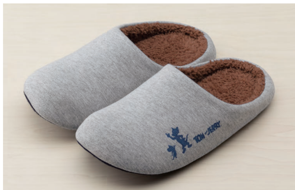
(サイズ:M(~24.0cm)/L(~27.0cm)各2,500個)※サイズをお選びください。