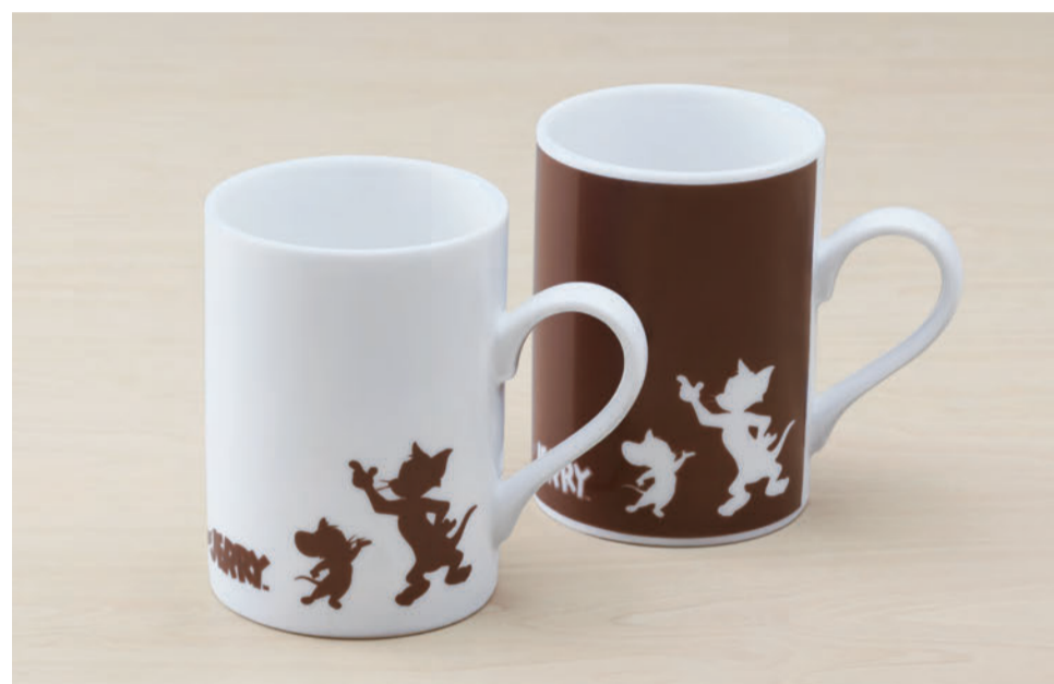
(色:ホワイト/ブラウン各1,750個)※色をお選びください。