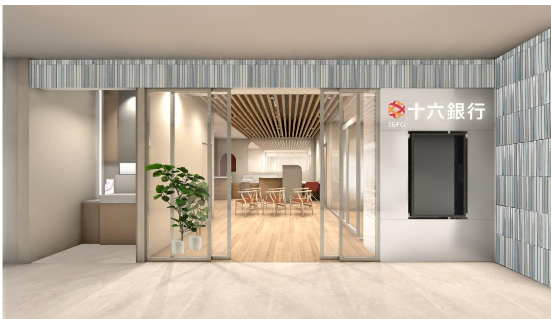
【新県庁支店のイメージ図】