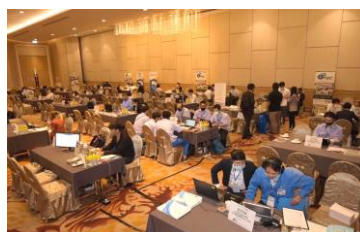
2020年FBCバンコクウェブ商談会の様子